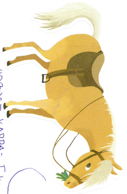
HOBUSE KAPPA- MINE [keelelaksud] 3x nodeläbide